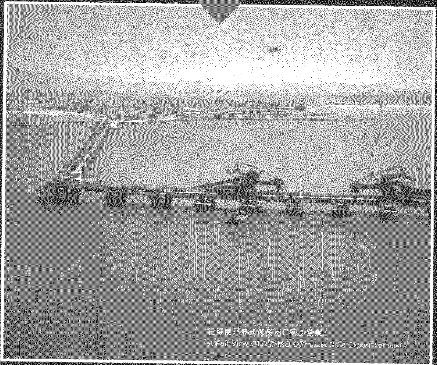
日照市开放式煤炭出口码头全景